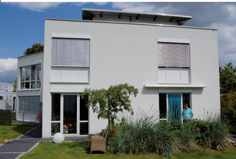
Das moderne Gebäude der Klages & Partner GmbH bietet Platz für über 20 Mitarbeiter.